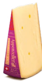
Appenzeller® Edel-Würzig Reifedauer: garantiert 9 Monate