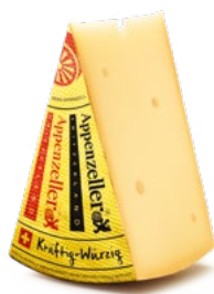
Appenzeller® Kräftig-Würzig Reifedauer: 4 – 5 Monate