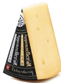
Appenzeller® Extra-Würzig Reifedauer: garantiert 6 Monate