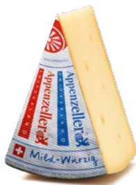
Appenzeller® Mild-Würzig Reifedauer: garantiert 3 Monate