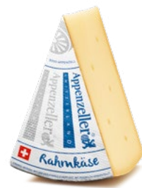
Appenzeller® Rahmkäse Reifedauer: garantiert 3 Monate